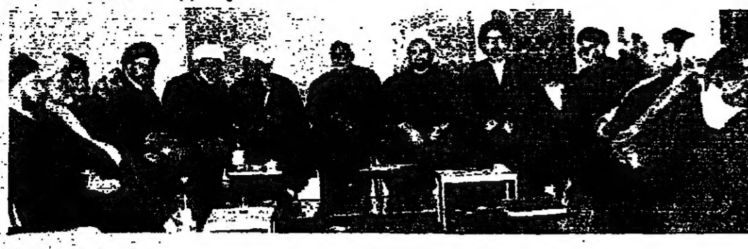
جانب من اجتماع علماء الطائفة الشيعية أمس

اجتمع علماء الطائفة الشيعية في بيروت امس في جلسة استثنائية لبحث قضية المهجرين من الجنوب اللبناني الذين طردوا من اراضيهم في حزيران ١٩٦٨. وشارك في الاجتماع علماء من طائفتي النجاشية والعلوية، وهم من اهل الجنوب الذين طردوا من اراضيهم في حزيران ١٩٦٨. وشارك في الاجتماع علماء من طائفتي النجاشية والعلوية، وهم من اهل الجنوب الذين طردوا من اراضيهم في حزيران ١٩٦٨. وقال الشيخ محمد باقر الصدر، وهو من علماء النجاشية: «نحن نطالب بالعمل على إعادة المهجرين من الجنوب الى اراضيهم في جنوب لبنان، وهذا هو الحل الوحيد الذي يضمن لهم حياة كريمة في اوطانهم». وشارك في الاجتماع علماء من طائفتي النجاشية والعلوية، وهم من اهل الجنوب الذين طردوا من اراضيهم في حزيران ١٩٦٨.